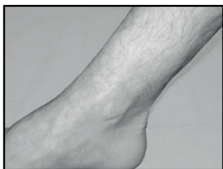
na - après after - nach - dopo

uw mening / resultaat votre opinion / résultat your opinion / result Ihr(e) Meinung / Resultat il vostro parere / risultato