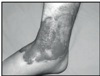
voor - avant before - vor - prima

in silicone - indumenti di compressione - idratazione